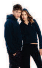
B&C Hooded & B&C Cat /women